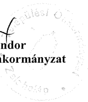
Bedó Lajos Sándor Zalahaláp Község Önkormányzat polgármestere