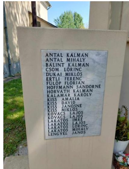
A ( 1939-1945.) II. világháborúban elesett lesenceistváni áldozatok emlékére állította Lesenceistvánd település lakossága.