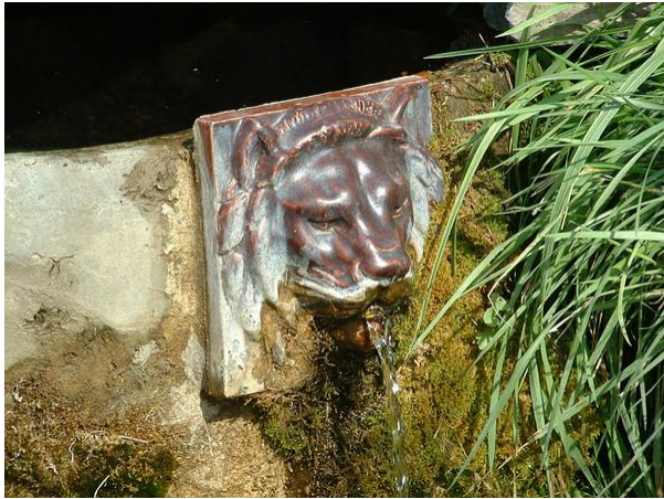
Oroszlánfejes kialakítású kifolyó a Máté-kútnál

A forrás jelenlegi foglalatának kialakítása az 1950-60-as években történt meg, közel 275 méteres szintmagasságban. A forrásház a forrásterület legnagyobb forrásának a befoglalásával létesült. A Máté-kútból eredő forrás vize homokból fakad, agyagos pannóniai rétegek határán a lösz alól. A kutat a helyiek és a hegyben élők a mai napig használják és takarítják. Vize tiszta és iható. Vízhozama jelenleg 1,8-2,0 l/p (szivárgó jellegű). A forrás a helybeliek jelentése és az irodalom szerint csökkenő vízhozamú, még sohasem apadt ki, de a vízhozama az időjárástól függően (beszivárgott csapadékmennyiség) ingadozó. A vízzáró réteg 2 méter mélységben még nem jelentkezik.