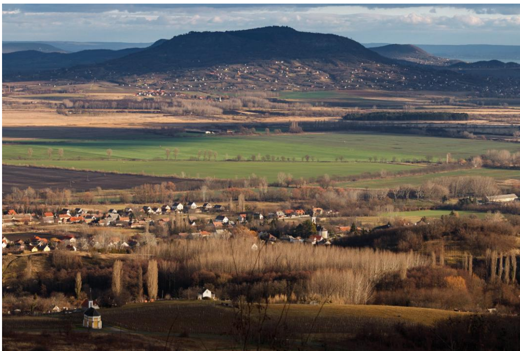
Kilátás a Kő-orráról a Szent György- hegyre

A 400 méteres Kő orra nevezetű kilátópont kis kitérő az Országos Kéktúráról, de annál nagyobb élmény! Lépésről lépésre nyílik ki előttünk a Tapolcai-medence, melynek nyugati oldalán találjuk a legszebb panorámát.